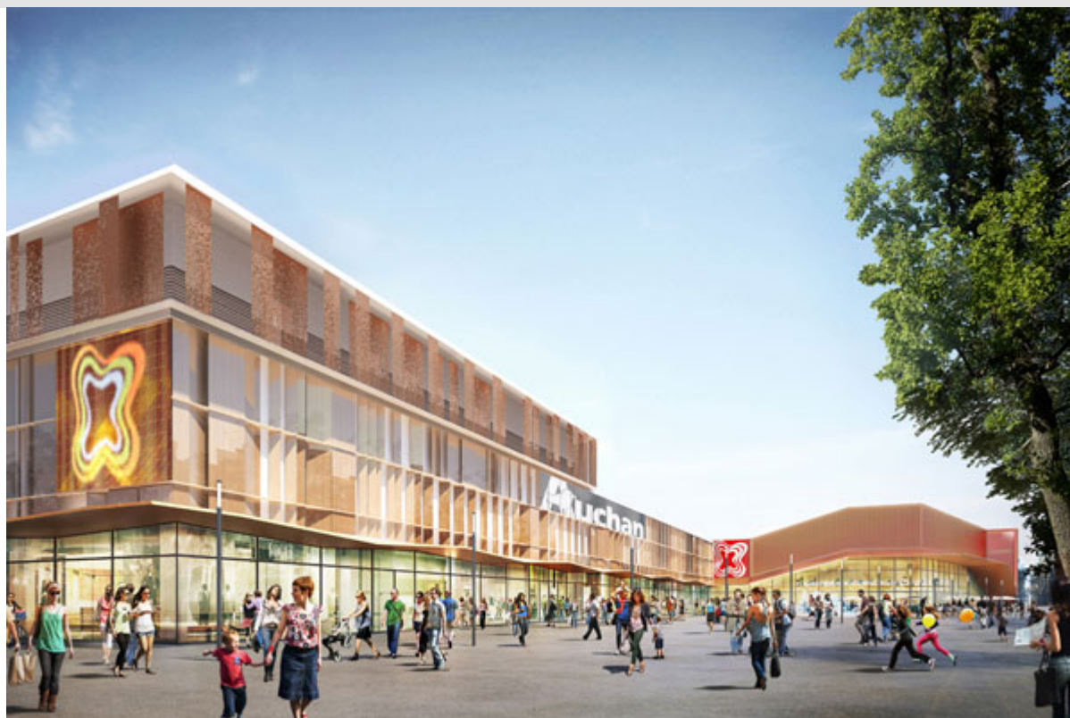
L'enseigne Auchan toujours présente dans la perspective de la future extension