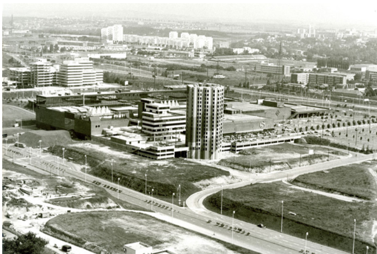
La Samaritaine, fleuron du centre commercial tout juste sorti de terre

Harponné par la concurrence, Les 3 Fontaines – détenu en majorité par le groupe Hammerson – fait l'objet en 2006 d'un premier projet de rénovation-extension qui n'aboutit pas. C'est en 2015, qu'une grande opération de rénovation est finalement décidée : 20 millions, du sol au plafond. Après douze mois de travaux, des 3 Fontaines, il ne reste que le nom. Tout à changé, ou presque. Repensé autour de trois éléments – l'eau, la nature et la lumière –, le centre renaît de ses cendres. De nouveaux espaces de repos, dont certains végétalisés, un espace dédié aux enfants, une fontaine digitale... de quoi propulser les 3 Fontaines dans l'ère de la modernité. Cerise sur le gâteau : une fontaine de quatre mètres de hauteur, composée de trois vasques en apesanteur et de 117 flotteurs, occupe l'espace central. L'honneur est sauf, il y a enfin trois fontaines aux 3 Fontaines ! Mais le centre commercial va plus loin : wifi gratuit et illimité, bornes interactives, application mobile... Le doyen des années 70 passe aux nouvelles technologies. Les 3 Fontaines entamera bientôt sa troisième vie. Une opération d'extension de grande ampleur débutera en avril... une nouvelle résurrection !