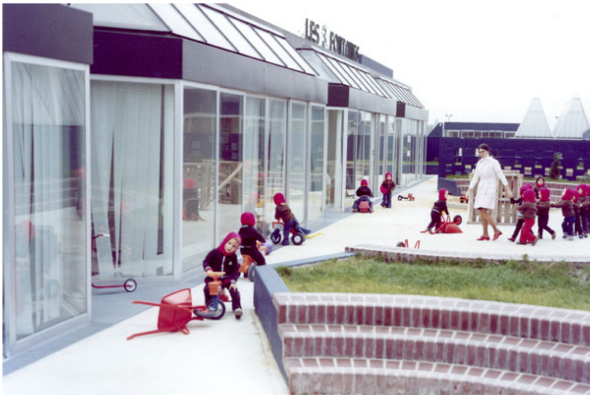
La crèche était située sur le toit du centre commercial

En France, dans les années 70, les centres commerciaux sont encore marginaux et le plus souvent situés en périphérie des centres. À l'opposé du modèle américain, Les 3 Fontaines s'impose comme le centre névralgique de la ville nouvelle. Un pôle attractif à la fois accessible par l'autoroute, les voies piétonnes et les transports en commun, et donc totalement intégré au centre ville. Claude Vasconi l'a imaginé comme une « locomotive ». Les 3 Fontaines - dont le nom proviendrait du lieu-dit d'origine sur lequel il est implanté - a vocation à rayonner sur toute la région. Les statistiques sont d'ailleurs formelles : à moins de 20 minutes de voiture vivent 350 000 clients potentiels. À son ouverture, les décideurs ont donc vu les choses en grand. Sur les 53 000 m 2 s'installe la crème de la crème : la Samaritaine, le supermarché Super-M, 80 commerces, deux cinémas, un bowling, une discothèque... et même une crèche !