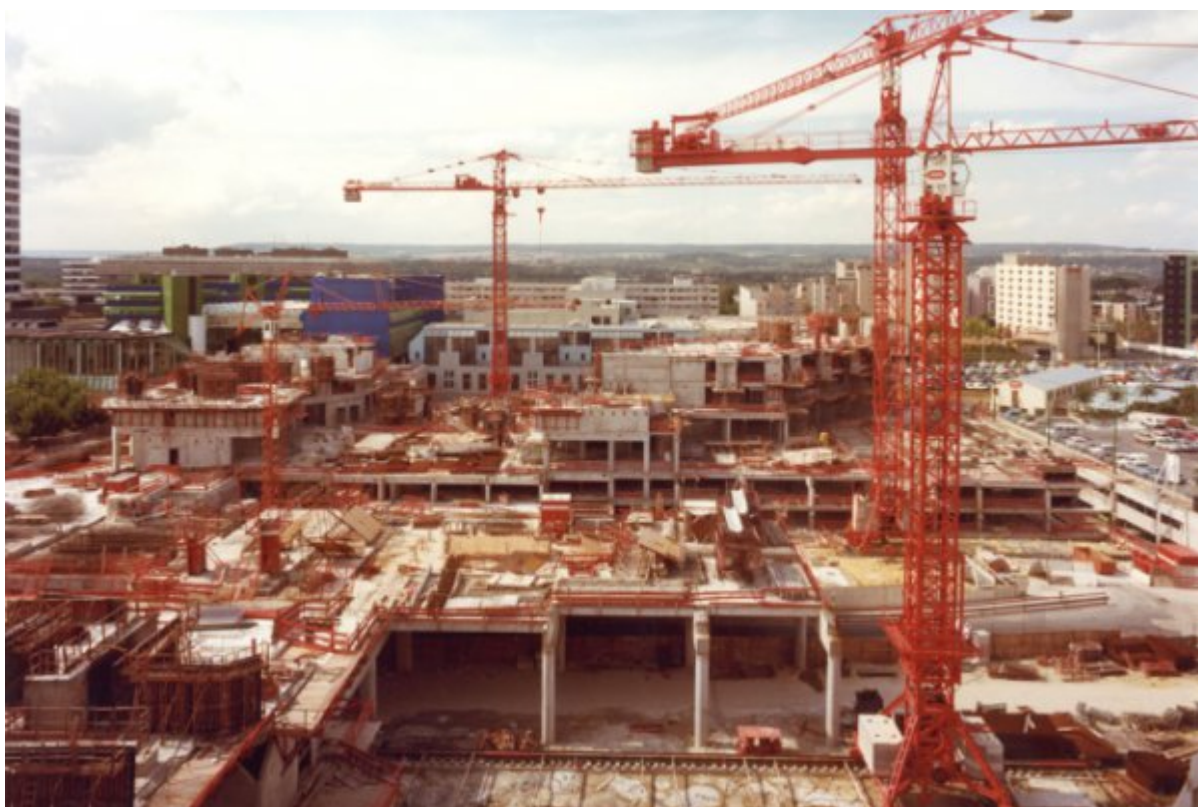
La construction du centre commercial des 3 Fontaines en 1972

Le centre commercial Les 3 Fontaines a vu le jour en 1972. En 45 ans, il a eu plusieurs vies. Pierre angulaire de la ville nouvelle dès sa création, objet d'une rénovation il y a peu, il aborde une nouvelle phase avec son extension prochaine.